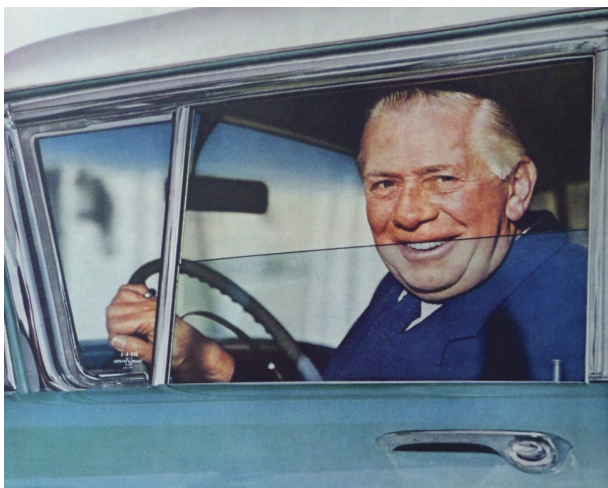
Ray Collins als Polizeileutnant Arthur Tragg,