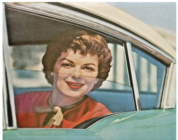
Barbara Hale als Della Street

Die Idee ist in den letzten Jahrzehnten weiterentwickelt worden, und der Standard ist heute um einiges höher. Fahrzeuge mit Bronze gefärbten Scheiben sind ausgelaufen. Klarglas gibt es aktuell noch bei Nutzfahrzeugen vornehmlich Japanischer Marken. Ansonsten wird heute Grünes Autoglas bevorzugt das die Eigenschaften von E-Z-Eye Glas klar übertrifft. Zwei bekannte Ausreisser in dieser Liga sind Mercedes und BMW. Die setzten vor nicht allzulanger Zeit noch auf Blau gefärbte Scheiben.